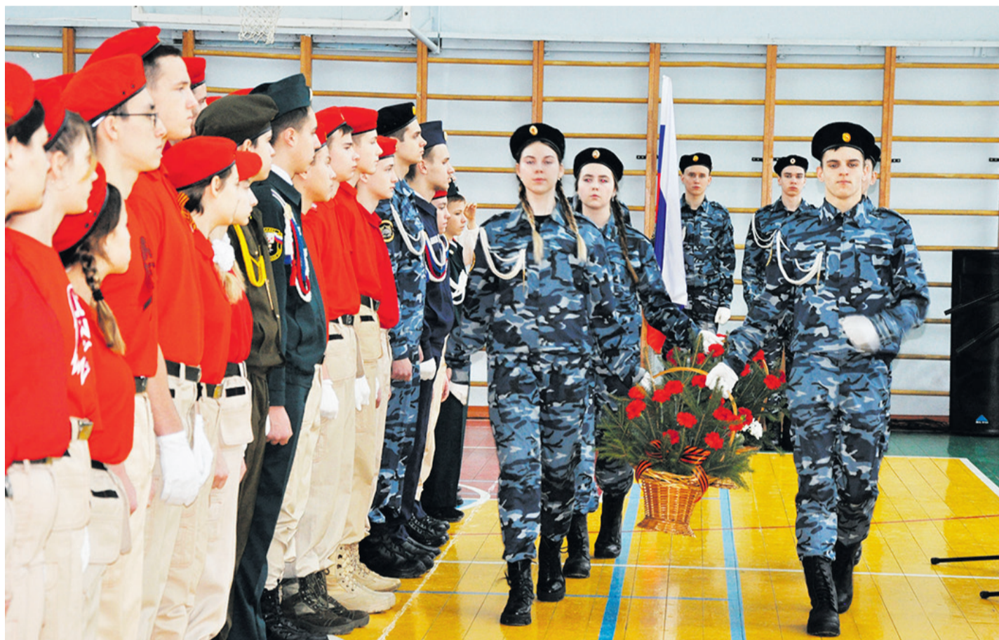
Кадеты Корочанской школы несут цветы к мемориалам в парке Памяти и Славы