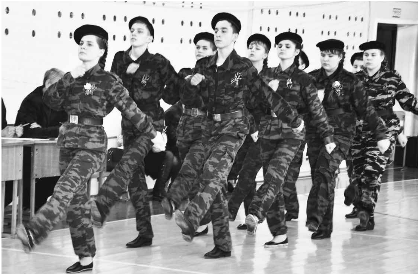
Хотя конкурс проводят накануне Дня защитника Отечества, в числе командиров и звеньевых — молодые корочанки