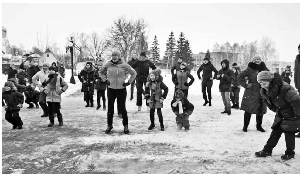
Зарядка с чемпионом не только полезное, но и весёлое занятие