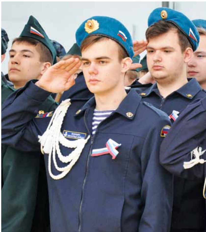
Военная и строевая подготовка популярна среди корочанской молодёжи

Кто победил в смотре-конкурсе кадетских классов