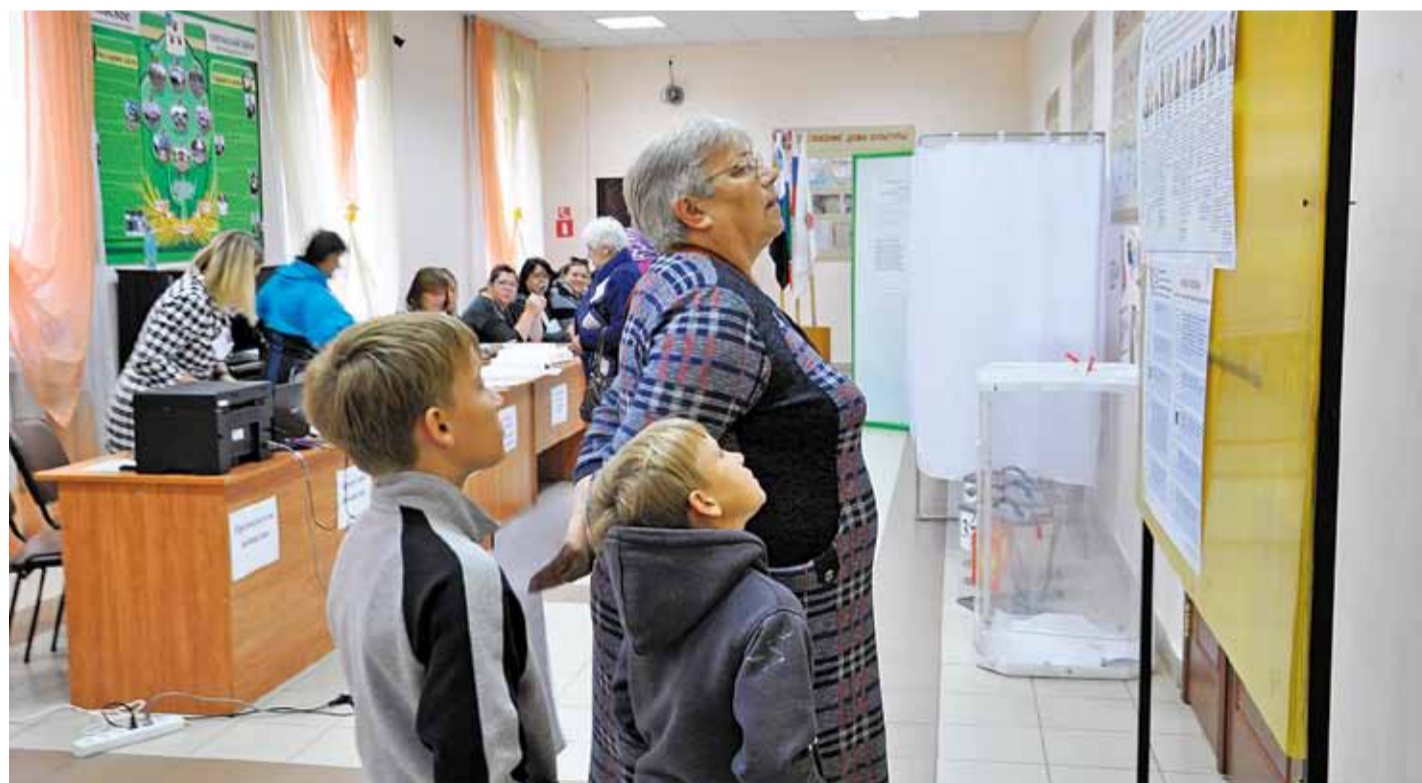
На избирательном участке № 657 в селе Ломово

8–10 сентября в муниципалитете прошли выборы