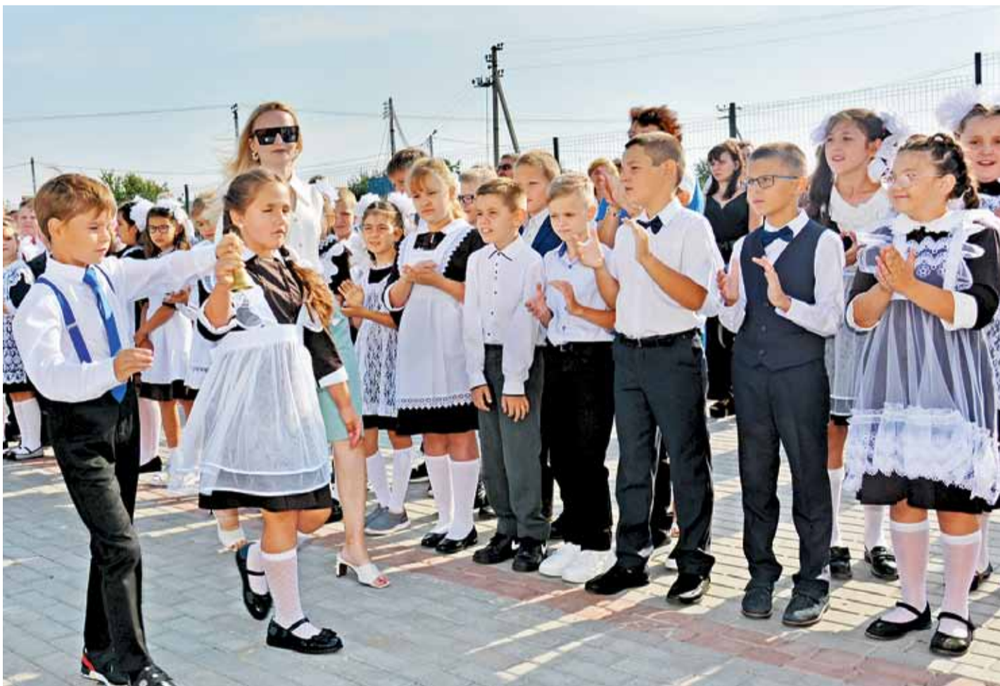
Первый звонок доверили дать первоклассникам

Занятия в дальнеигуменской школе-детском саду «Улыбка» начались в очном формате