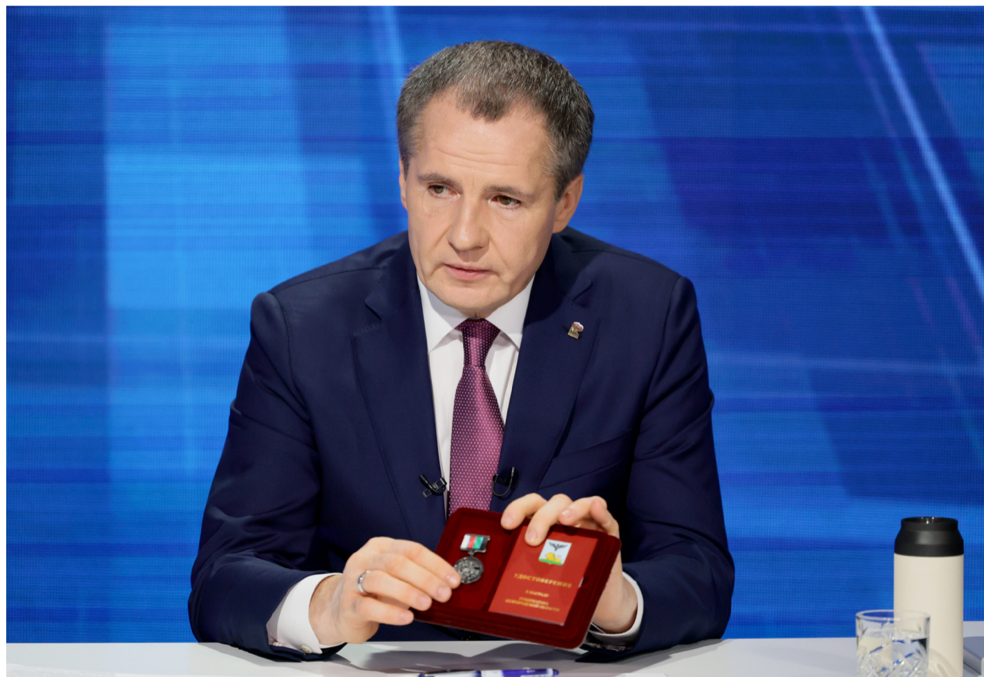
В ходе прямой линии губернатор Вячеслав Гладков представил медаль для бойцов белгородской самообороны

Губернатор Вячеслав Гладков 2 ноября ответил на вопросы жителей региона